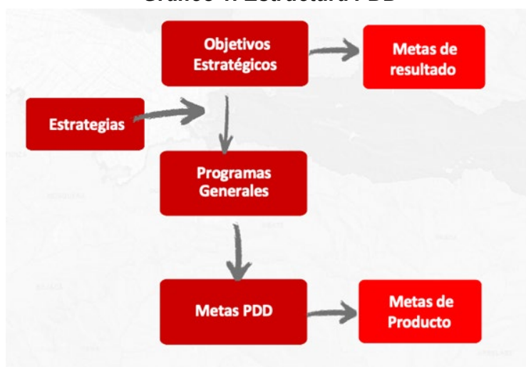
Gráfico 1. Estructura PDD

Artículo 6. La estructura del Plan Distrital de Desarrollo. La estructura del Plan Distrital de Desarrollo 2024-2027 “ Bogotá camina segura ”, en adelante el Plan Distrital de Desarrollo, se concreta gráficamente así: